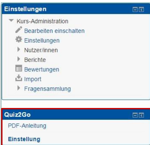
Abb. 1: Quiz2Go-Block im E-Testbereich von L 2 P

Der Quiz2Go-Block ist in allen E-Testbereichen automatisch freigeschaltet. Sie sehen ihn in den E-TESTS unterhalb der EINSTELLUNGEN für die KURS-ADMINISTRATION (s. Abb. 1).